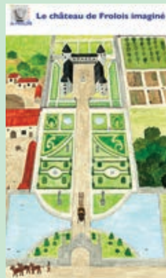
Château imaginé en perspective inversée. Dessin de N. Goedert-Paymal

Arch. Dép. Meurthe et Moselle 1926 - W 66