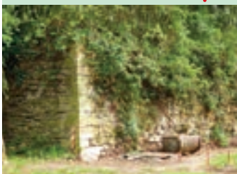
4 - angle du château présent dans une douve