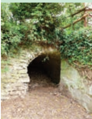
2 - passage entre les deux douves