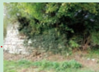
6 - base d'une tour