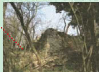
7 - angle de la terrasse