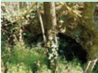
1 - arche du plan d'eau