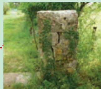
5 - entrée de la terrasse