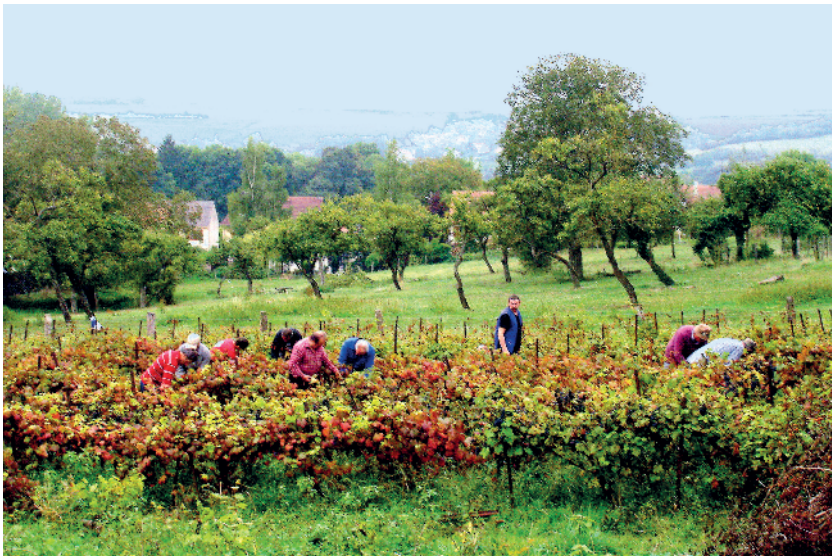
Dernière vendange à Frolois en 2009

vous fera découvrir le bouleversement de la viticulture à la fin du 19 e siècle. Tout le vignoble fut dévasté et dut intégralement se reconstruire.