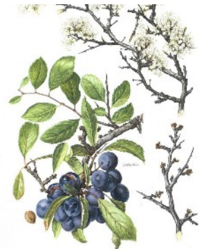
Prunellier ou épine noire