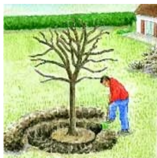
Creuser une tranchée circulaire autour du tronc