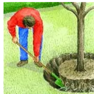
Couper les racines en creusant en biais