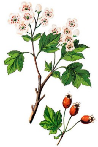
Aubépine ou épine blanche