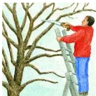
Enlever une partie de la ramure

Par transplantation (facile sur des petits arbres) :