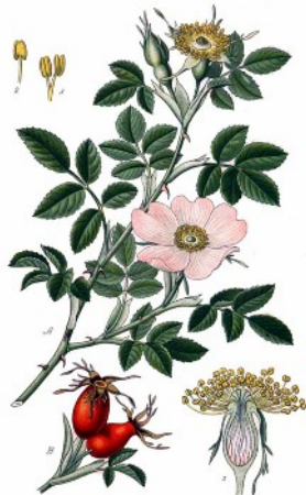
Rosa canina ou églantier ou gratte-cul